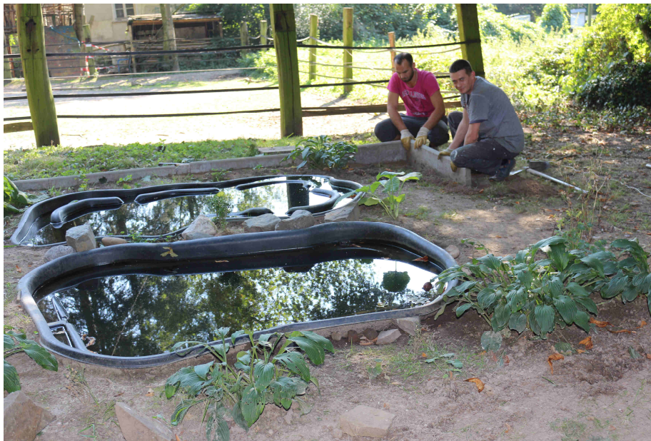
Unser Biotop wird neu angelegt