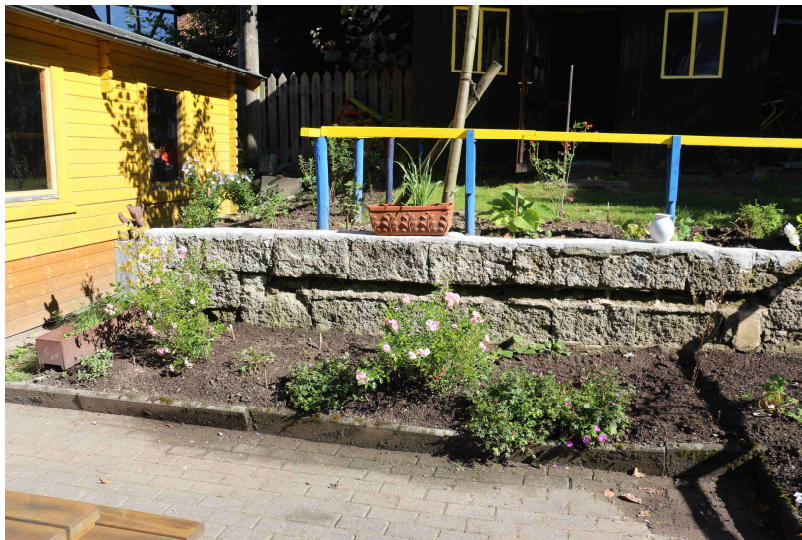
Zahlreiche Beete angelegt, Zaun angebracht

Nominiert für den Bürgerpreis der Deutschen Zeitungen 2010