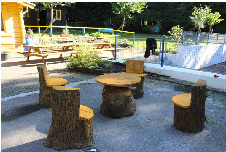
Sitzgruppe für die Kinder gebaut