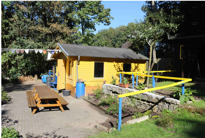
Werkstatt, Geräteschuppen, Gelände aufgeräumt

bereits an Grundkenntnissen im handwerklichen Bereich und darüber hinaus sind sie auch inzwischen so eingebunden in ihr Studium, dass sie sowieso keine Zeit haben.