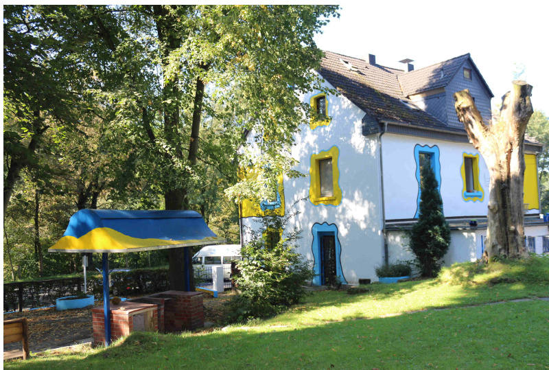
„Hilfe in Haus und Gelände“ Die Rück- und Seitenwand des Hauses frisch gestrichen.