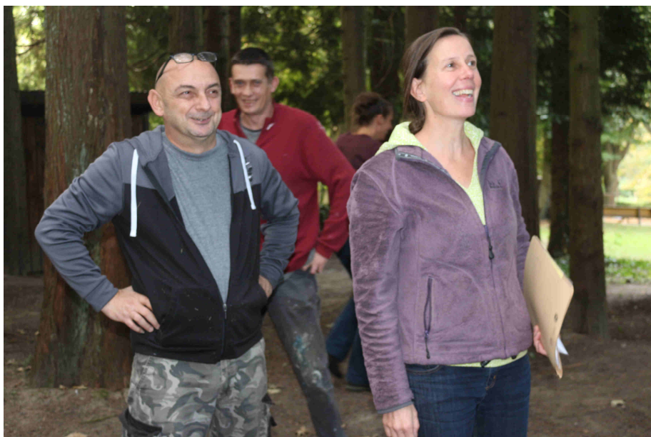
Und ENDLICH steht der erste Teil vom Kletterparkour – vielen Dank!