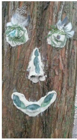
Vorher – nacher