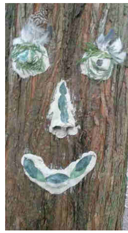
Vorher – nacher