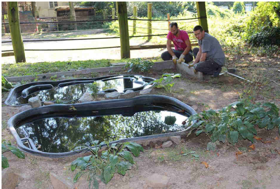
Unser Biotop wird neu angelegt