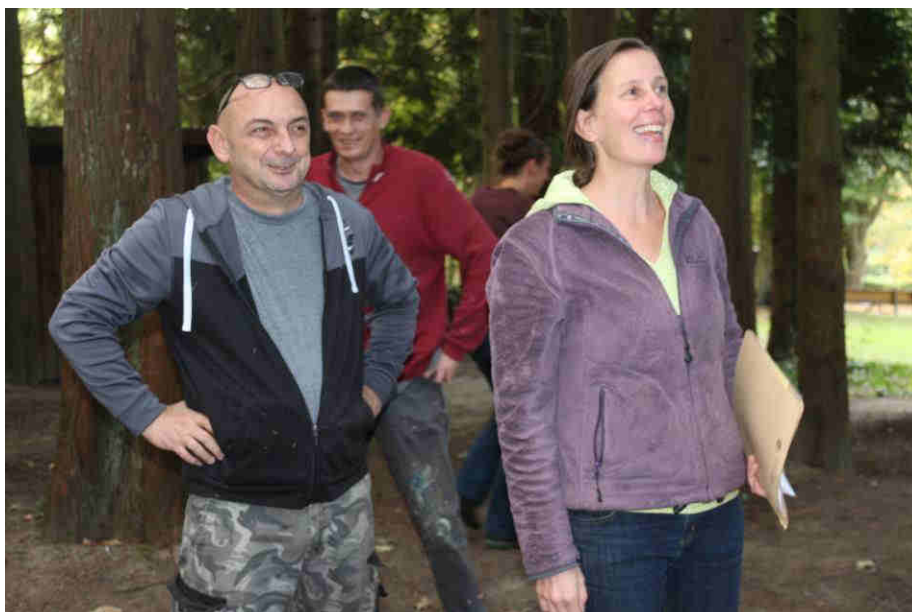
Und ENDLICH steht der erste Teil vom Kletterparkour – vielen Dank!