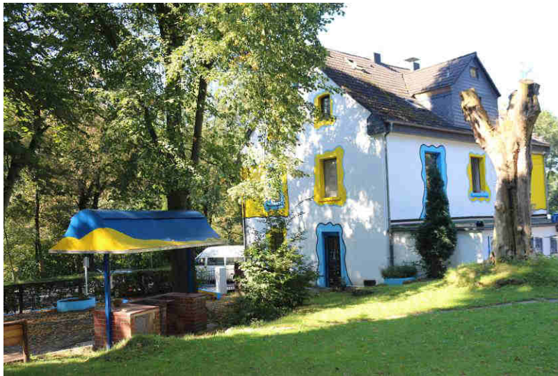
„Hilfe in Haus und Gelände“ Die Rück- und Seitenwand des Hauses frisch gestrichen.