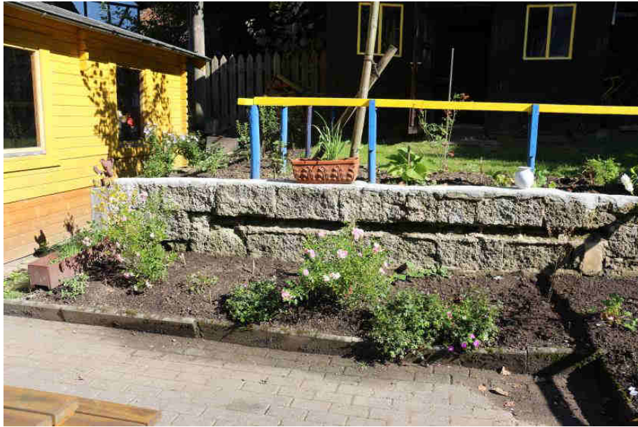
Zahlreiche Beete angelegt, Zaun angebracht